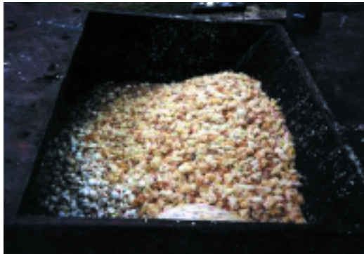
...I pulcini maschi, inutili, finiscono in discarica

Le galline “ovaiole” appartengono ad una razza selezionata per la produzione